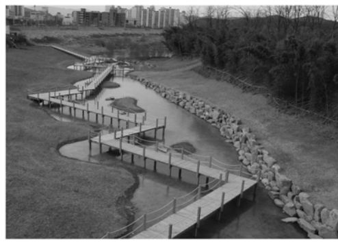
울산 태화강 생태공원