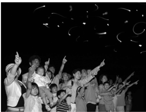
무주 반딧불이 축제