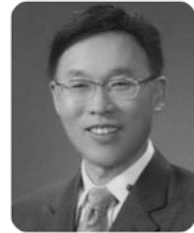
조 병 옥 2)