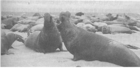
강한 유전자를 가졌다는 시위

정자를 받아들이려는 본능이 있게 된다. 그러나 실제 이것은 그리 간단한 문제가 아니다. 그래서 강한 유전자를 받아 들이도록 생리적 현상을 발달시켜 왔다. 남자는 한번 성관계를 (사정하면) 한 다음에 어느 정도 시간이 지나야 다시 성관계를 할 수가 있다. 그러나 여자는 여러 번 성관계를 맺으면서