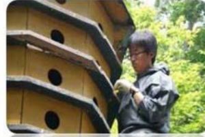
집비둘기 알 채취