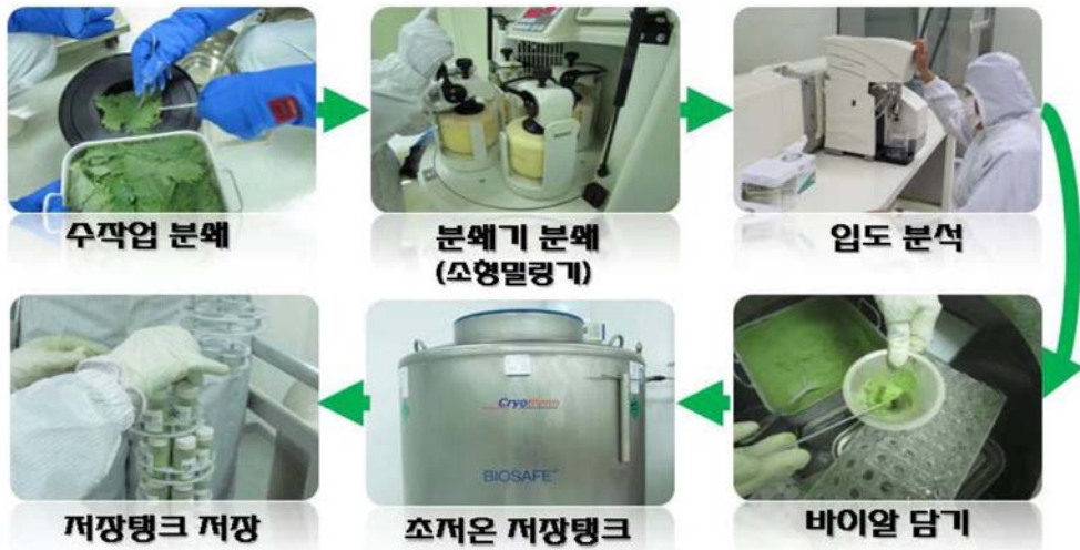
그림 4. 환경시료 분쇄 및 저장