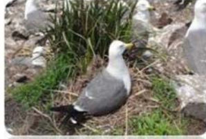
괭이갈매기 알 채취