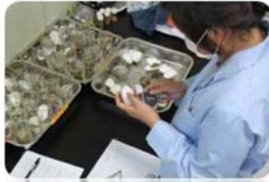
괭이갈매기 알 측정