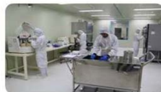
시료 쇼저온 분쇄 정정실