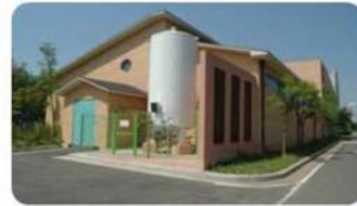
육외 액체질소 공급탱크