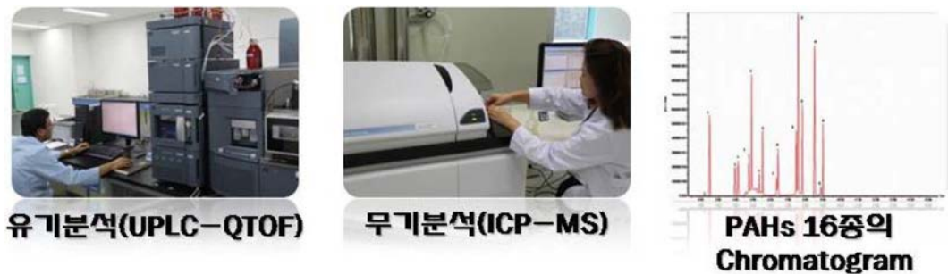
그림 7. 초저온 환경시료 오염물질 분석

향후 분석대상항목을 잔류성유기화합물 (Persistent Organic Pollutants, POPs)로 확대할 예정이다.