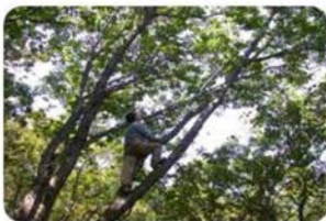
신갈나무 잎 채취