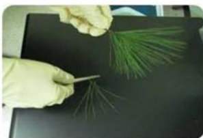
잣나무 잎 측정 준비