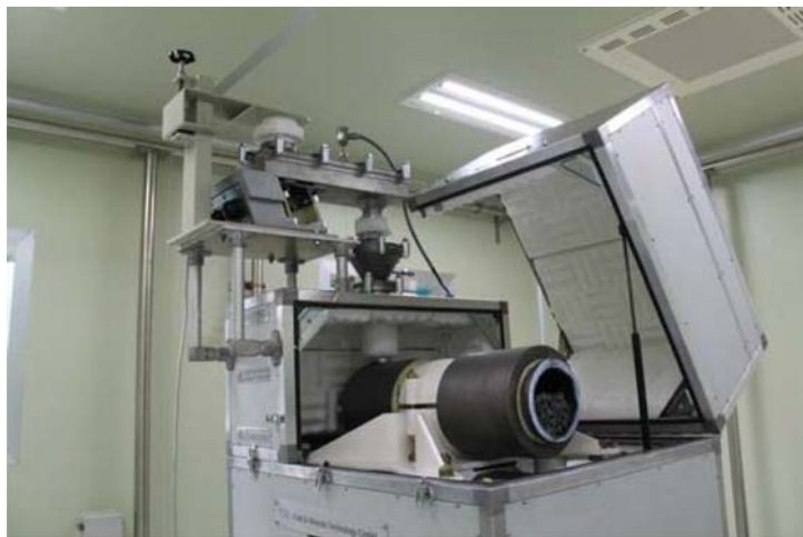
그림 5. 초저온대형밀링기

을 유지하면서 시료를 분쇄할 수 있는 장점이 있다. 분쇄 시료가 적절히 균질화되었는지 여부는 입도분석(분쇄 입자 >90%, 입도 <200 μm)을 통해 판단한다. 분쇄된 시료는 바이알(glass vial)에 저장되는데, 시료의 속성정보와 위치정보는 바코드화되어 관리된다. 이후 시료 바이알은 저장실의 초저온저장탱크에 최종적으로 저장된다. 저장실은 액체질소에 의한 질식위험을 미연에 방지하기