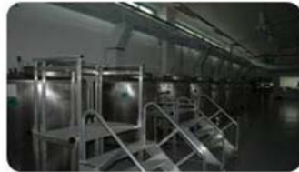
쇼저온 액체질소 저장 탱크