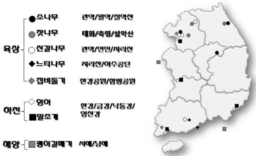
그림 3. 환경시료 채취지점

을 2009년도에 건립하였고, 환경시료의 채취 절차를 포함한 시료은행 표준운영절차(SOP)도 4년여에 걸쳐 마련하였다(그림 1). 그리고 현재는 표준운영절차를 현장에 적용하고, 개선사항을 연구하고 있다. 국가환경시료은행은 현재 육상, 하천, 해양생태계에서 총 8종을 채취하고 있다. 육상생태계에서 소나무, 잣나무, 신갈나무, 느티나무, 집비둘기 알을 채취하고 있고, 하천생태계에서 잉어, 말조개를 채취하고 있다. 해양생태계는 갯벌이갈매기 알을 채취하고 있다(그림 2). 그리고 종별로 지점 당 약 2~3 kg(조류 알과 말조개는 300~500 g)을 채취하고 있다(그림 3).