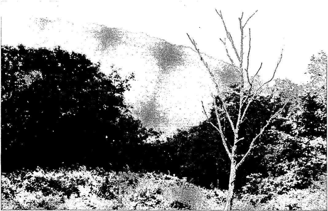
Fig. 1. Fire prevention border in Mt. Gyebang