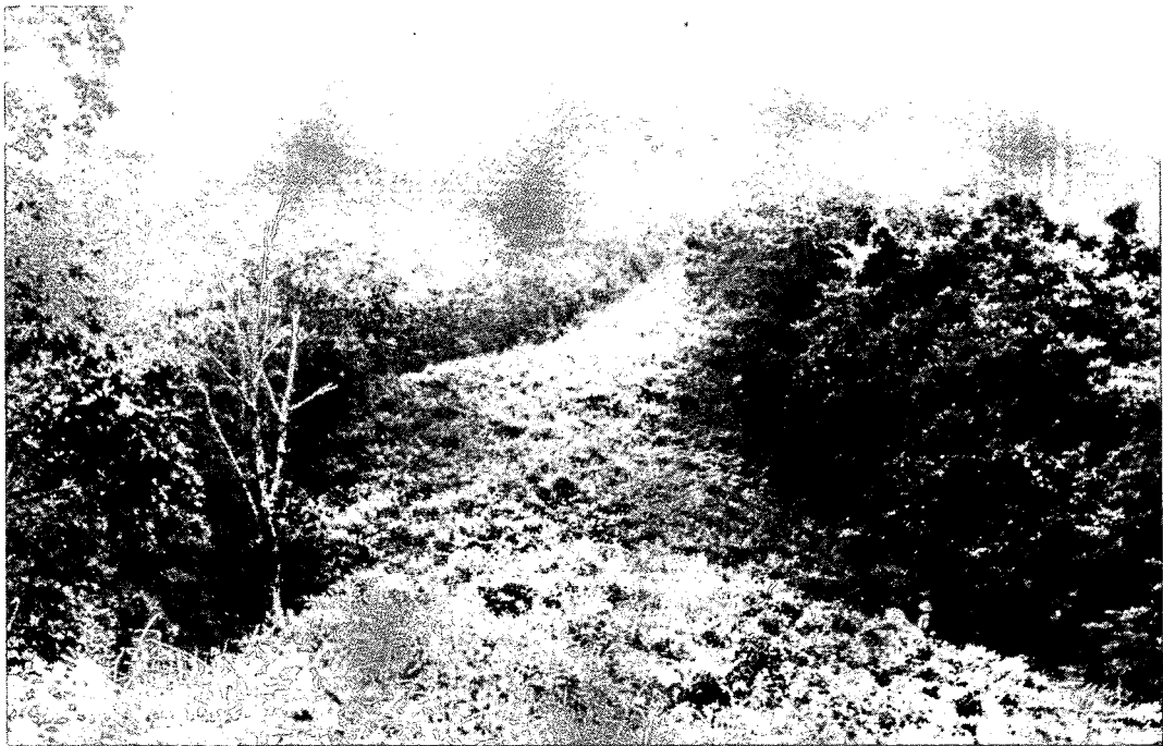
Fig. 2. Fire prevention border in Mt. Gyebang